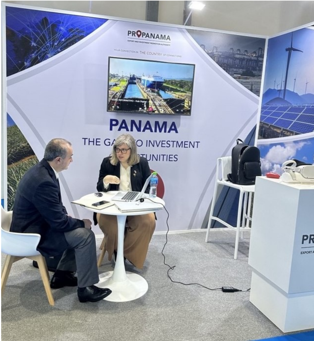
ATENDIENDO POTENCIALES INVERSIONISTAS EN EL STAND DE PANAMÁ