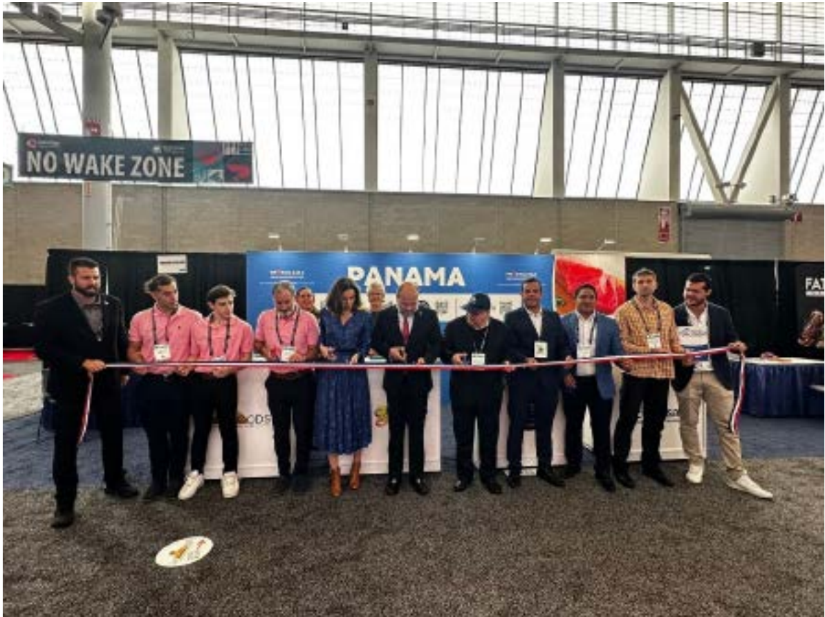
Corte de cinta en el SENA 2024