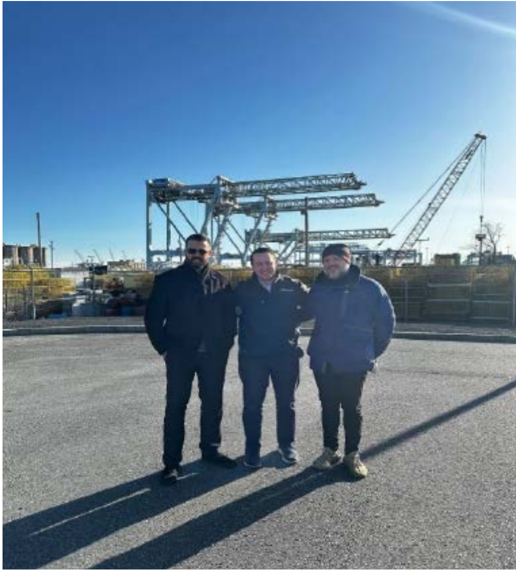
Visita al puerto de Boston