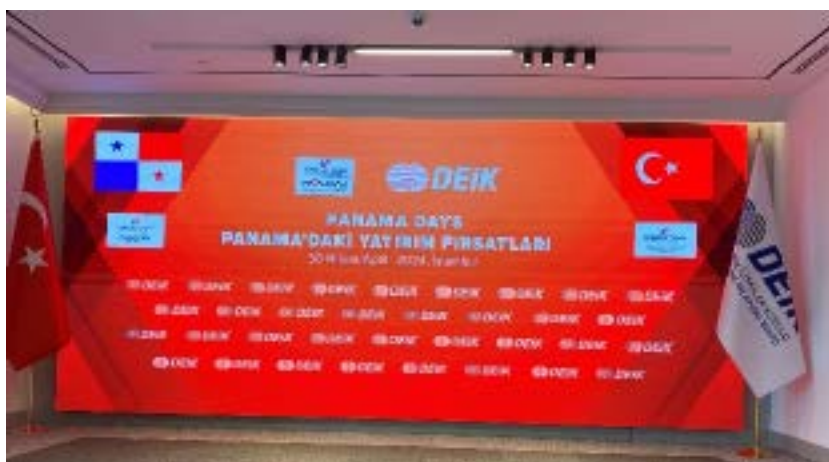
Conferencia - Panama Day Turquía