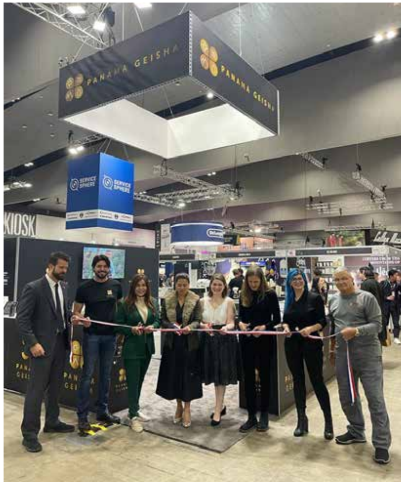
Corte de cinta para inaugurar stand de PROPANAMA con los organizadores de MICE y empresarios del Café