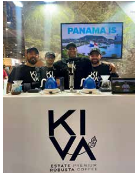
Representante del Canal de Panamá en temas de sostenibilidad junto con la asociación CUENCAFE y Representantes de KIVA ESTATE promoviendo Café ROBUSTA