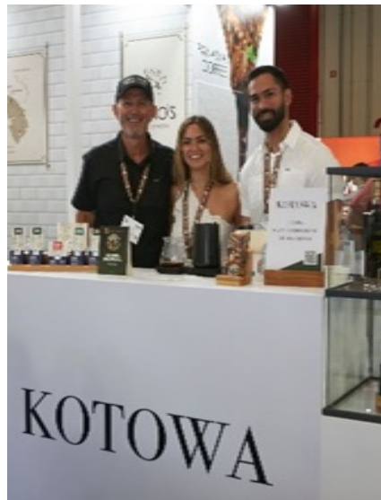
Representantes de KOTOWA, promocionando el café Geisha, el Primer Licor de Café Geisha y la variedad de Chocolate, de la casa Victoria Chocolate - como producto derivado del Cacao ante la comunidad europea.