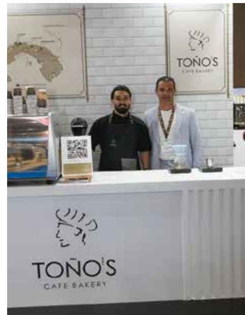
Representantes de EL BAJAREQUE y Toños Café Bakery, Franquicia Panameña que compra y vende café de especialidad en Panamá y que se está internacionalizando en el mercado griego.