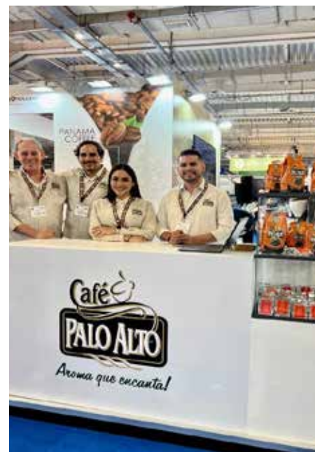
Representantes de CAFÉ SUAREZ, promocionando su variedad CATUAI y PANAMA GEISHA, junto a Palo Alto, promocionando la variedad ARABICA y Producto terminado.