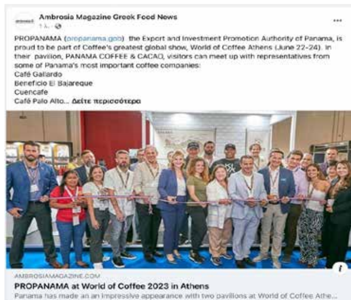
Delegación Panameña de productores y vendedores de Café