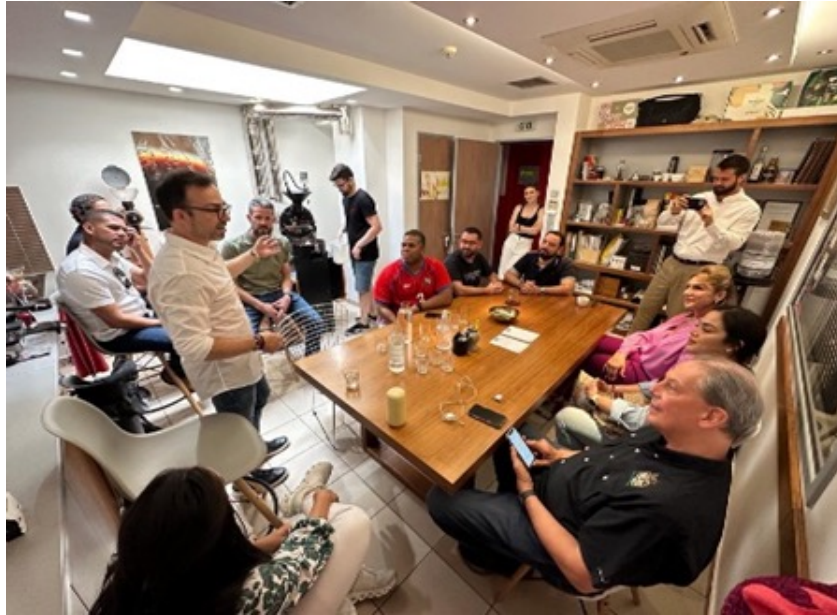
Todos los miembros de las Delegaciones - PANAMA COFFEE & CACAO, y 5 MIEMBROS PRINCIPALES DE SCAP.