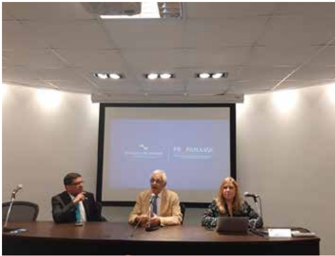
Conferencia con empresarios de Canelones