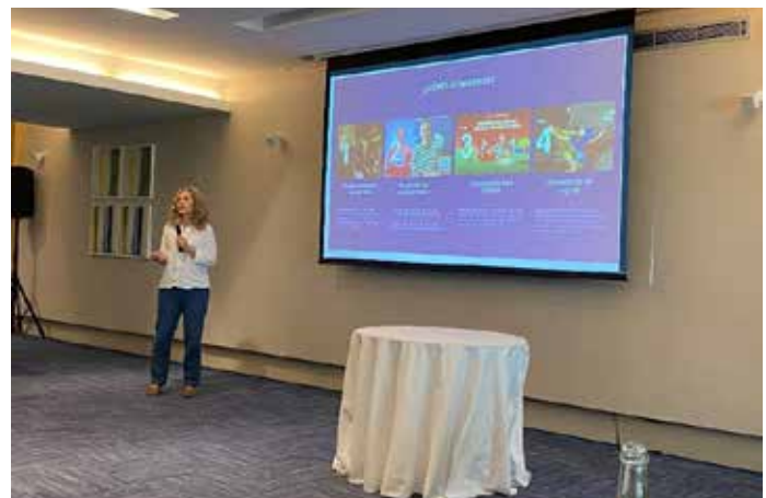
Seminario del 28 de octubre - intervención de Uruguay Colombia