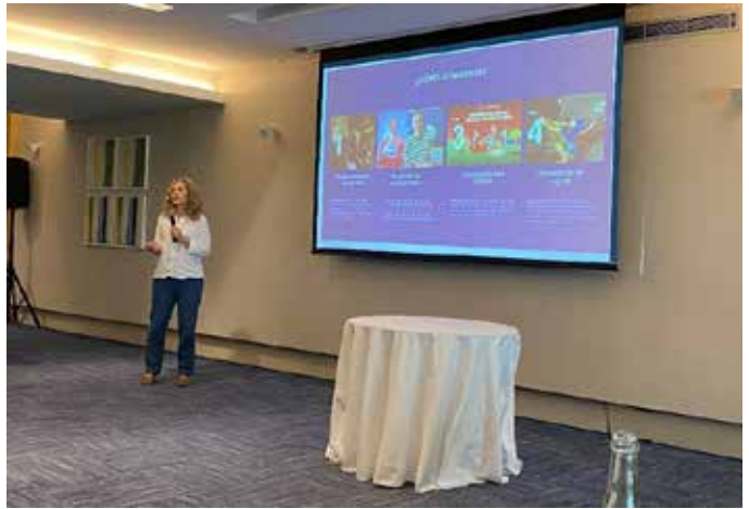
Evento de apertura del Foro de Marca País