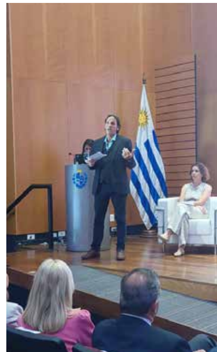
Evento de apertura del Foro de Marca País