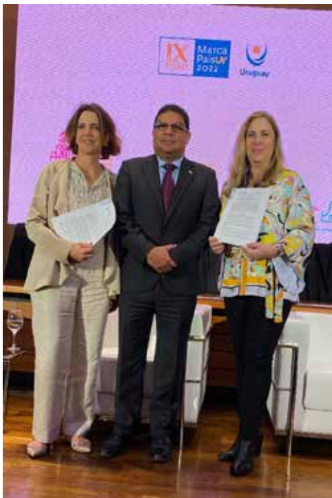
Firma del convenio de colaboración entre URUGUAY XXI y PROPANAMA