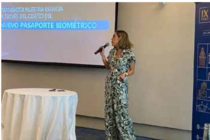
Seminario del 28 de octubre - intervención de Uruguay Costa Rica