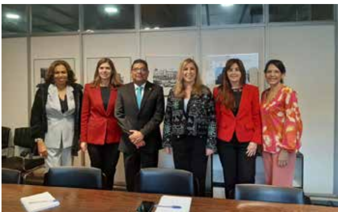
Visita de Cortesía a la Cancillería de Uruguay