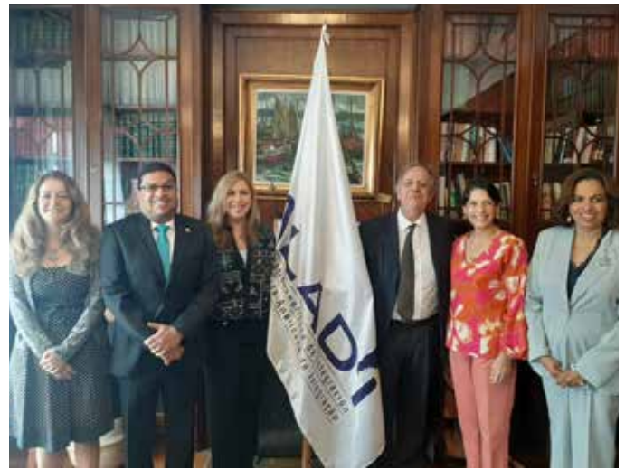
Visita a ALADI