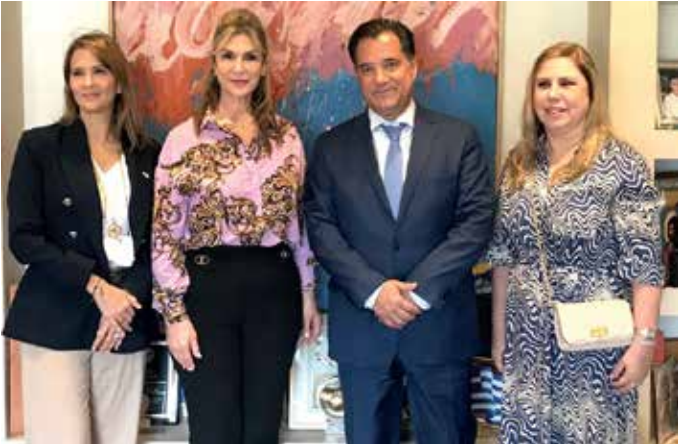
Delegación de PROPANAMA y la Embajadora de Panamá en Grecia sostiene reunión protocolar con el Ministro de Desarrollo e Inversiones de Grecia, Adonis Georgiadis.