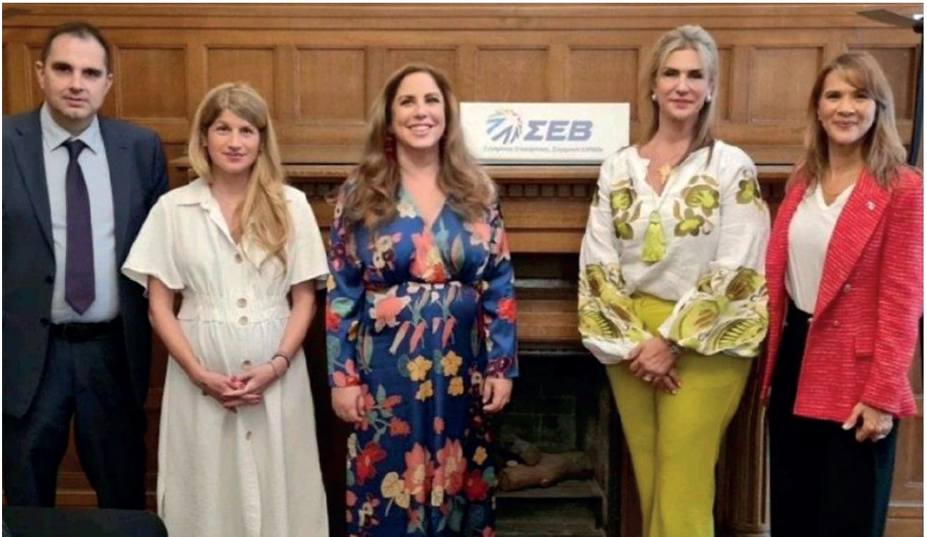
Encuentro con los miembros de la Federación Empresarial Helénica (SEV), para la coordinación de una misión comercial a Panamá de empresas griegas en 2023.