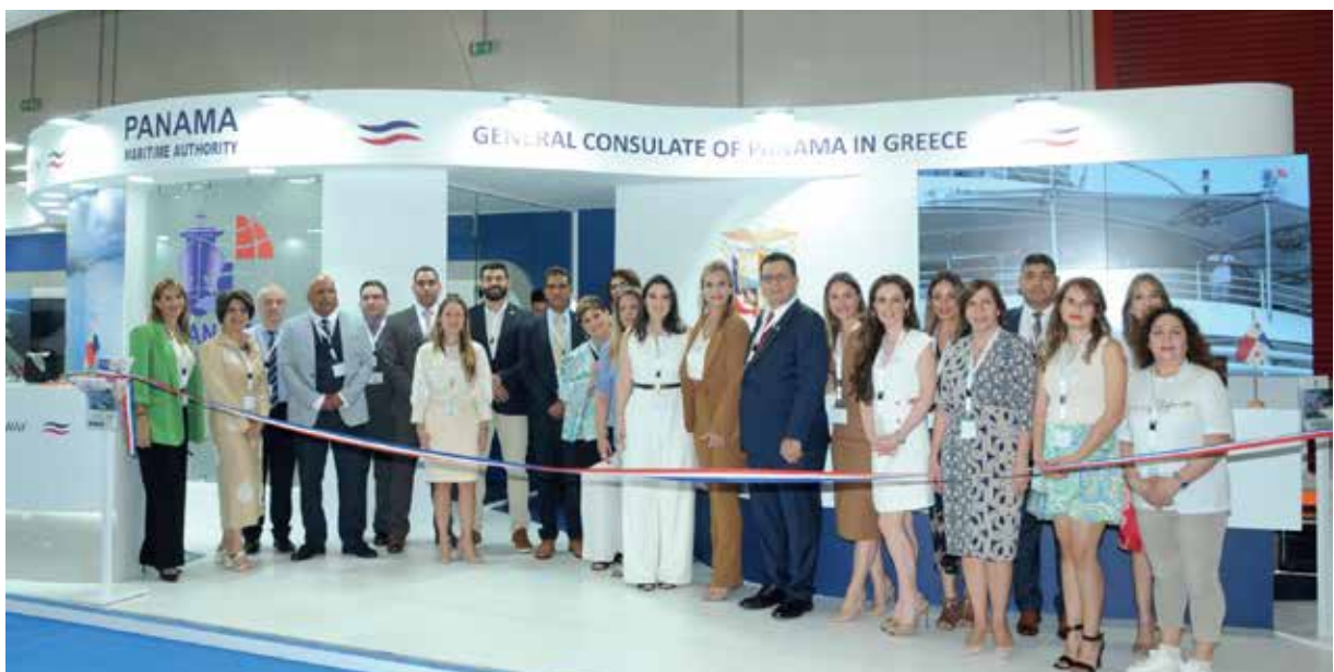
Personal de PROPANAMA y la Embajada y Consulado de Panamá en Grecia en el Pabellón de la República de Panamá en POSIDONIA 2022.