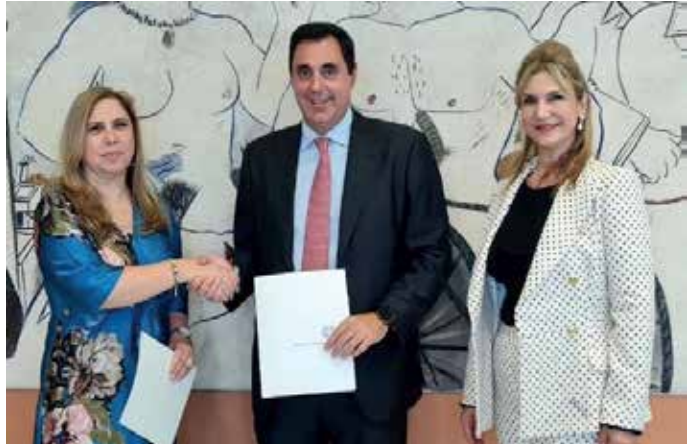
Se afianza alianza entre Panamá y Grecia con la firma de un Memorando de Entendimiento entre PROPANAMA y Enterprise Grecia SA.