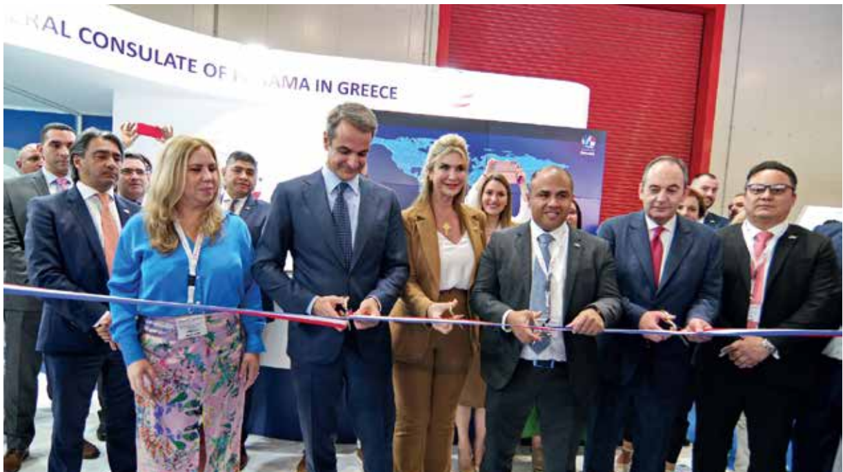
El Primer Ministro Kyriakos Mitsotakis corta la cinta inaugural del pabellón de la República de Panamá en Posidonia 2022.