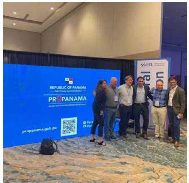
Desarrollo Shared Services & Outsourcing Week (SSOW) - Orlando, Florida.