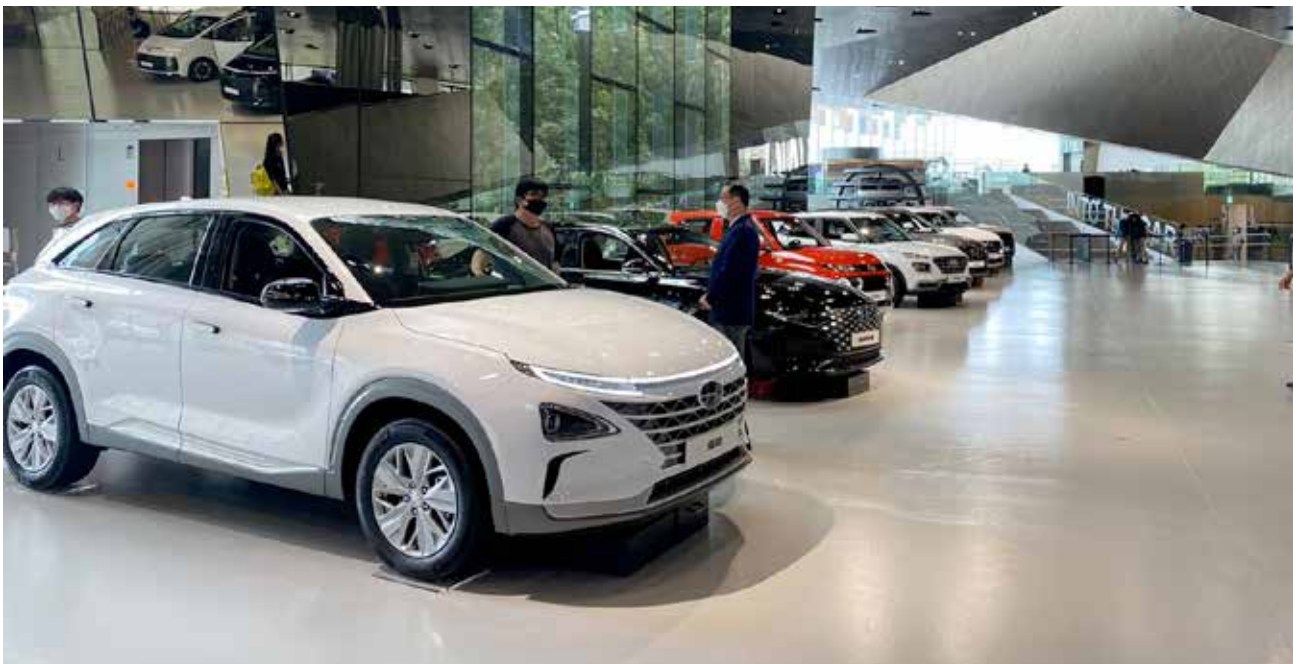
Visita en Hyundai Motor Studio.