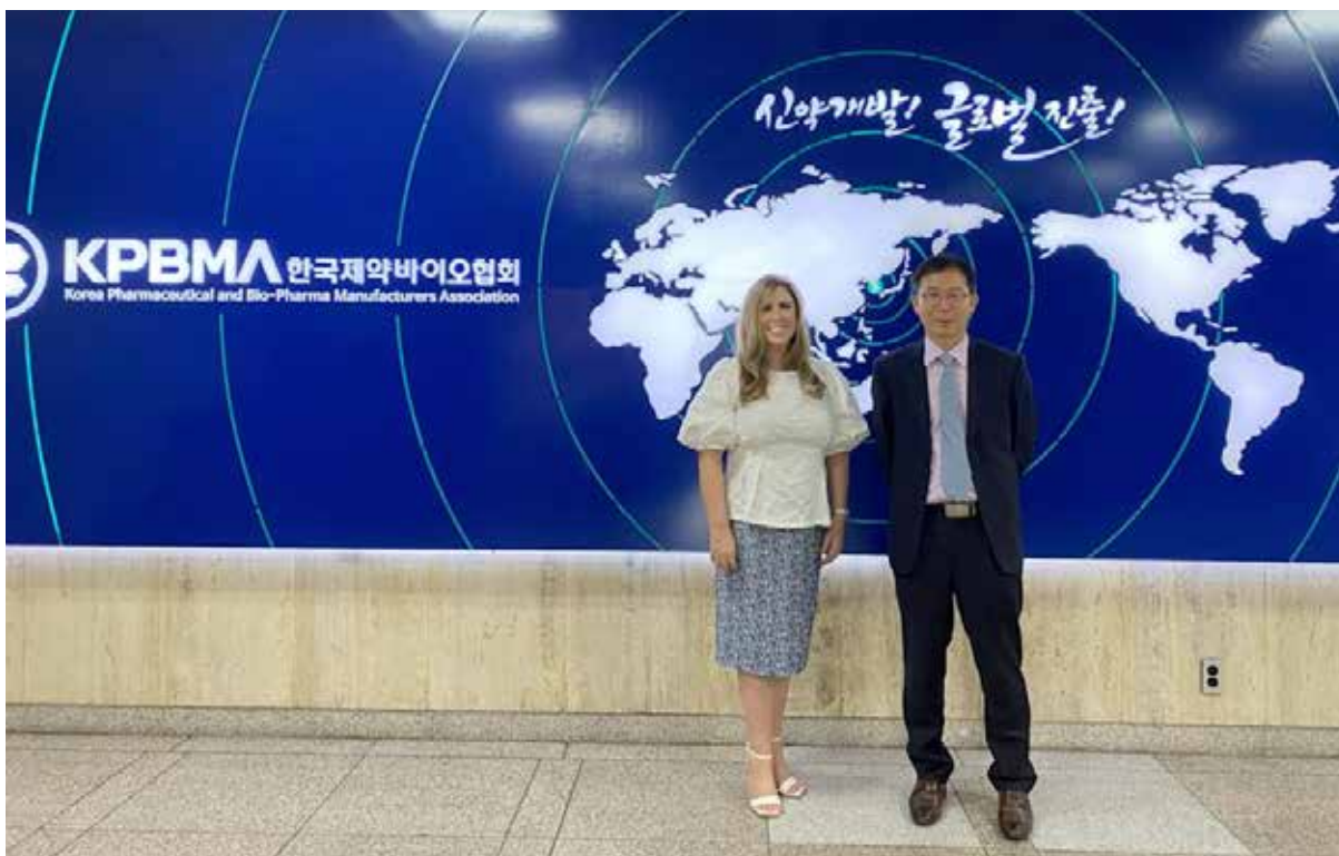
Reunión con representantes de la Asociación Coreana de empresas farmacéuticas (KPBM).