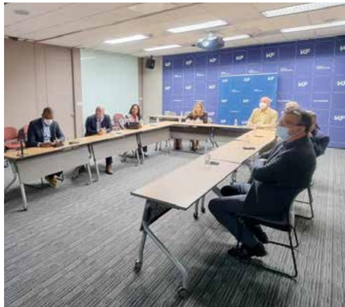
Reunión con representantes del Bank of Korea, en la que compartimos las oportunidades que ofrece Panamá como puente de entrada al mercado Latinoamericano, para la expansión de empresas surcoreanas.