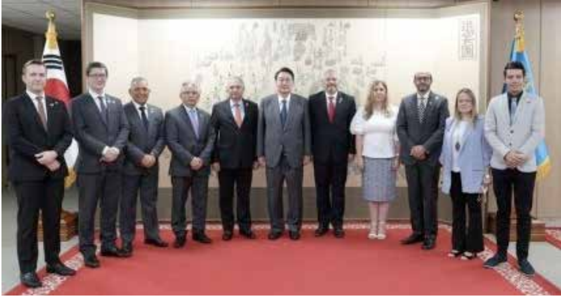
Reunión con el Presidente de Corea y ministros de 10 países de Latinoamérica.