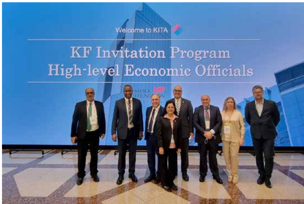
Visita a KITA donde conocimos el plan estratégico para impulsar el crecimiento económico de Corea y sus exportaciones, presentamos también las oportunidades que ofrece Panamá y su oferta exportable.