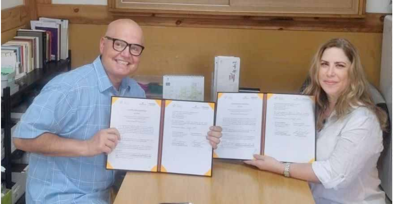
Firma de Acuerdo de Cooperación con la Cámara de Comercio de Ontario, fortaleciendo aún más el intercambio, las relaciones comerciales y económica entre Panamá y Canadá.