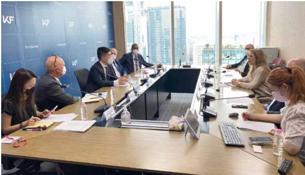
Reunión de bienvenida por parte de KoreaFoundation, donde participaron líderes de sectores económicos de Canadá, Jordania, Líbano, Angola y Panamá.